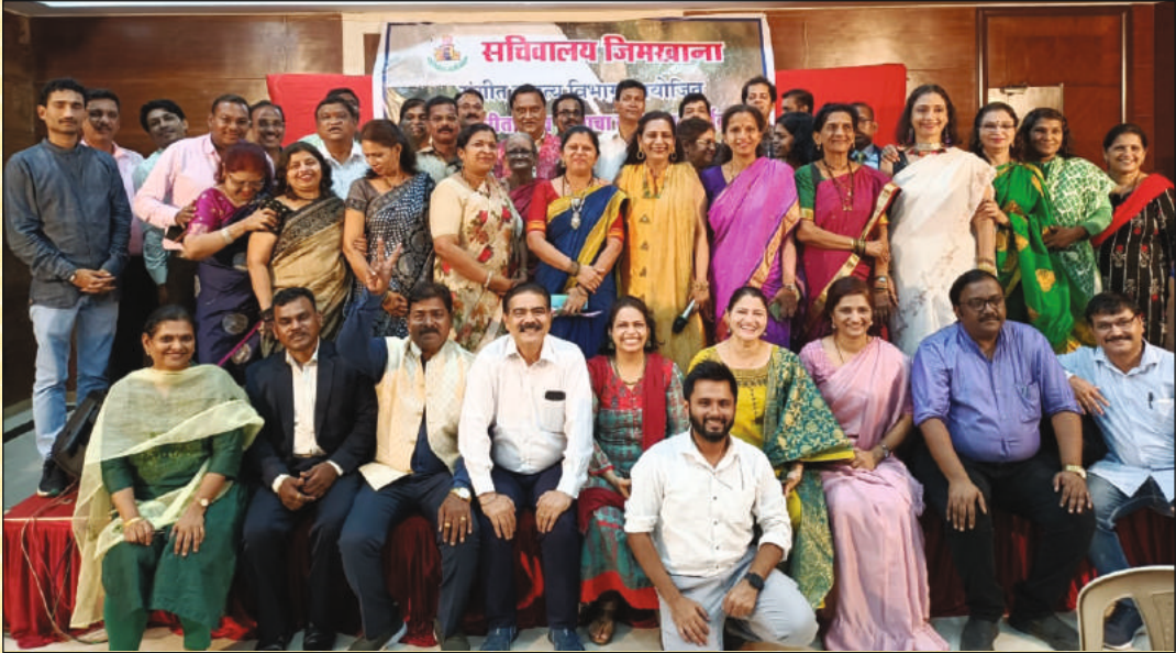
संगीत विभाग पावसाळी गाण्यांचा कार्यक्रम “कुछ कहता है ये सावन....”