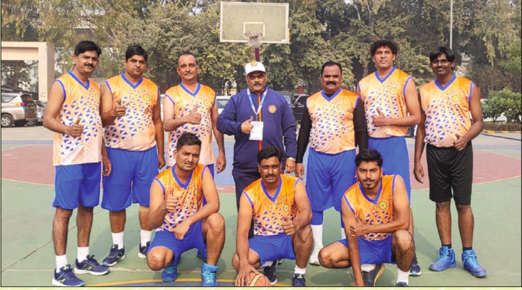
बास्केटबॉल स्पर्धा दिल्ली येथे सहभागी झालेला महाराष्ट्र राज्याचा संघ