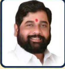
ना. श्री. एकनाथ शिंदे मा. मुख्यमंत्री, महाराष्ट्र राज्य व पदसिद्ध अध्यक्ष