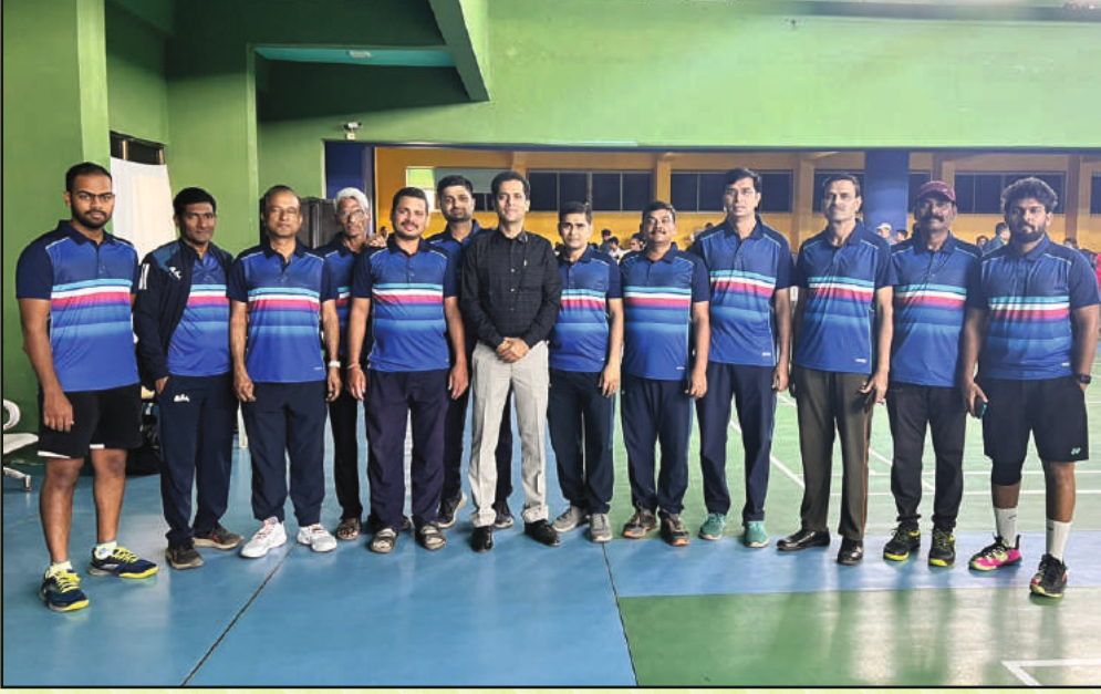
बॅडमिंटन स्पर्धेमध्ये सहभागी झालेला महाराष्ट्र राज्याचा पुरुष संघ