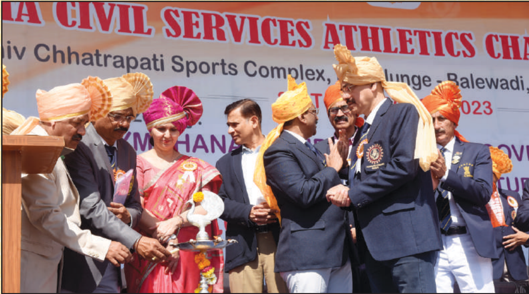
अॅथलेटिक्स स्पर्धा २०२२-२३ च्या उद्घाटन समारंभाच्या वेळी मान्यवर दीप प्रज्वलन करताना