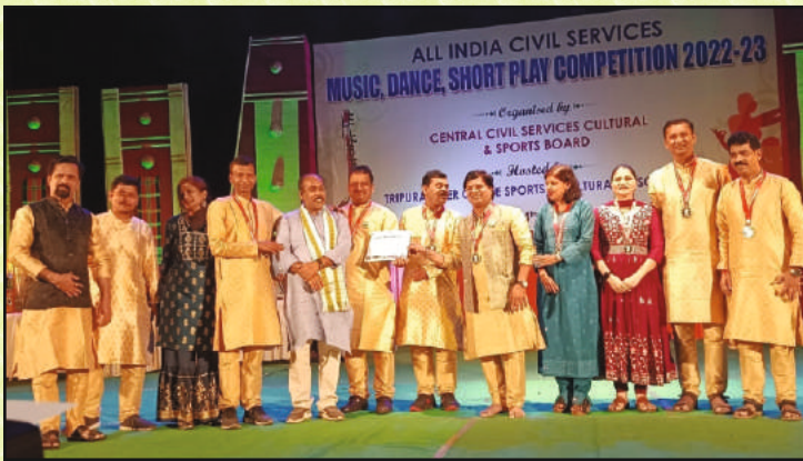
समूह गायन रजत पदक विजेता संघ