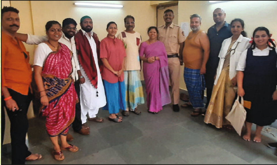
त्रिपुरा आगरतळा येथे महाराष्ट्र राज्याचे सहभागी कलाकार लघुनाट्य "दंगल सुरू आहे"