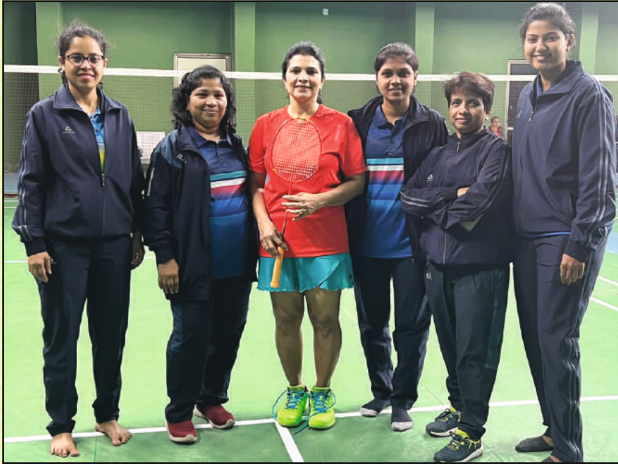
बॅडमिंटन स्पर्धेमध्ये सहभागी झालेला महाराष्ट्र राज्याचा महिला संघ