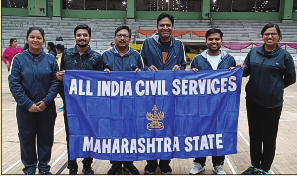
सहभागी झालेला महाराष्ट्र राज्याचा लॉन टेनिस संघ