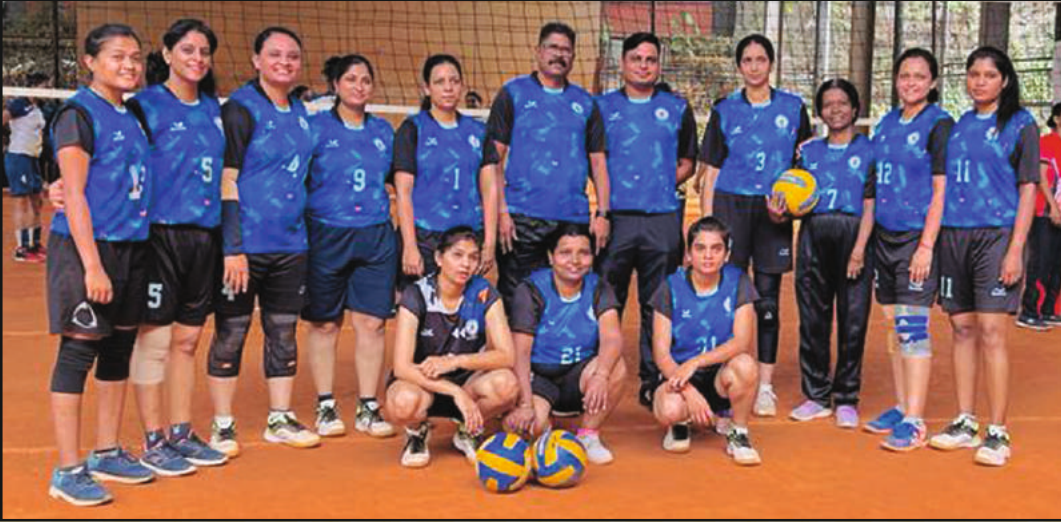
व्हॉलीबॉल स्पर्धेमध्ये सहभागी झालेला महाराष्ट्र राज्याचा महिला संघ