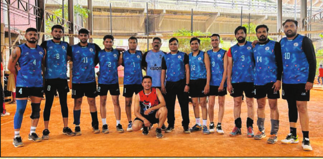
व्हॉलीबॉल स्पर्धेमध्ये सहभागी झालेला महाराष्ट्र राज्याचा पुरुष संघ