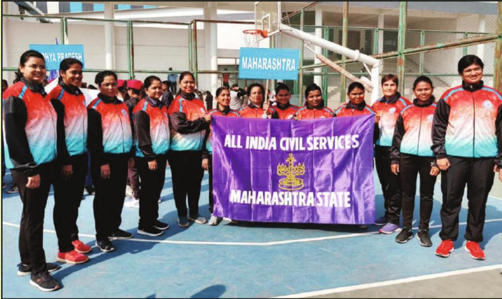
सहभागी झालेला महाराष्ट्र राज्याचा महिला संघ