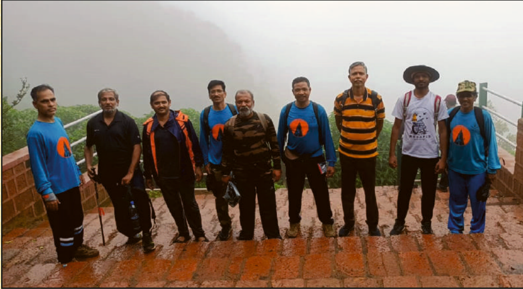
जुलै २०२१ मध्ये गिर्यारोहकांची वन ट्री हिल पॉईंट मार्गे माथेरान येथे यशस्वी चढाई