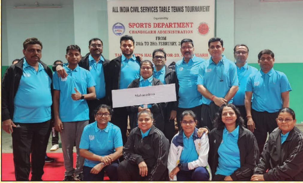
टेबल टेनिस स्पर्धेमध्ये सहभागी झालेला महाराष्ट्र राज्याचा संघ