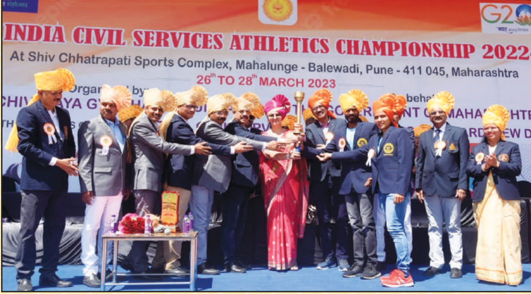
अॅथलेटिक्स स्पर्धेच्या उद्घाटनप्रसंगी मागील वर्षीच्या सुवर्ण पदक विजेत्या खेळाडूंकडून क्रीडा ज्योत स्वीकारताना मान्यवर