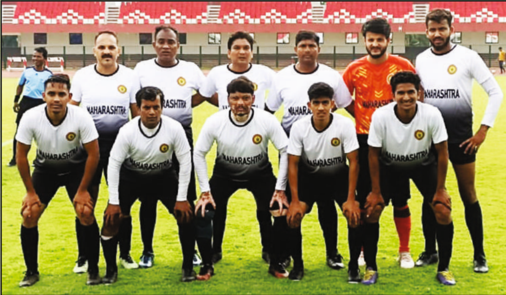
फुटबॉल स्पर्धेमध्ये सहभागी झालेला महाराष्ट्र राज्याचा पुरुष संघ