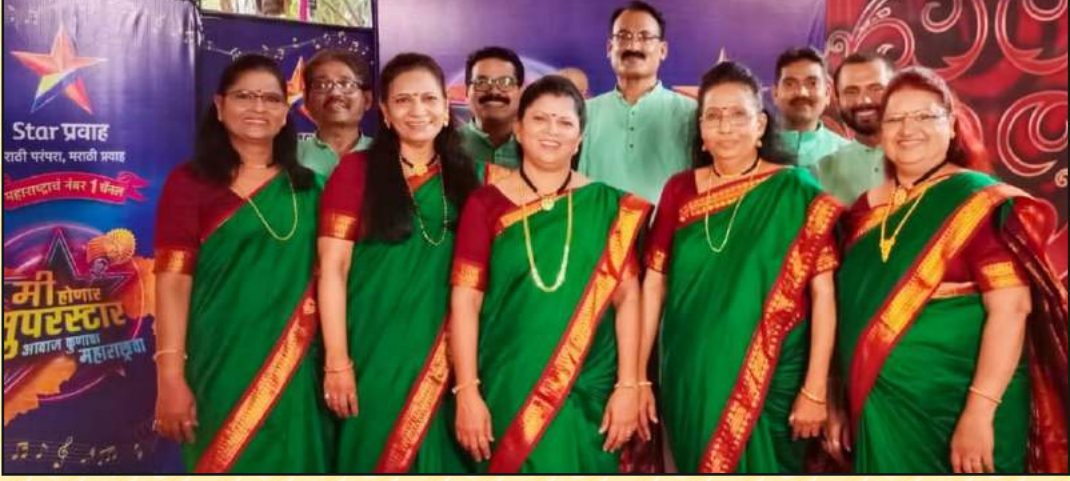
स्टार प्रवाह या दूरदर्शन वाहिनीवरील “मी होणार सुपरस्टार” या कार्यक्रमांमध्ये समूह गायन स्पर्धेत सहभागी झालेला सचिवालय जिमखाना संगीत विभागाचा संघ