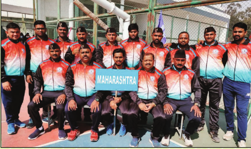
सहभागी झालेला महाराष्ट्र राज्याचा पुरुष संघ