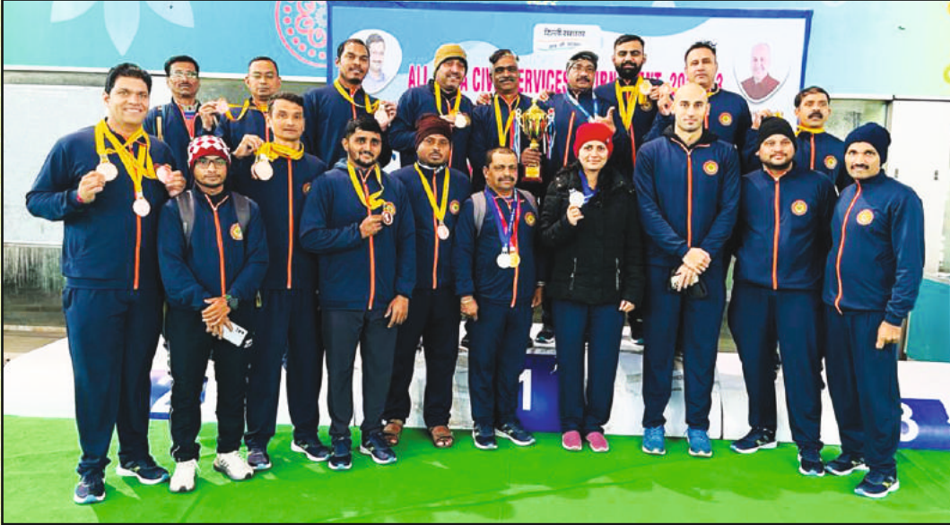
जलतरण संघ वॉटरपोलो स्पर्धेत कांस्य पदक पटकाविल्यानंतर आनंद साजरा करताना महाराष्ट्र वॉटरपोलो संघ