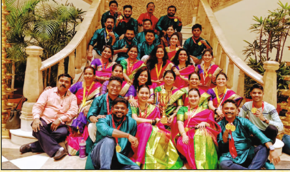
नवी दिल्ली येथे झालेल्या स्पर्धेमध्ये महाराष्ट्र राज्याचा चॅम्पियनशिप विजेता संघ