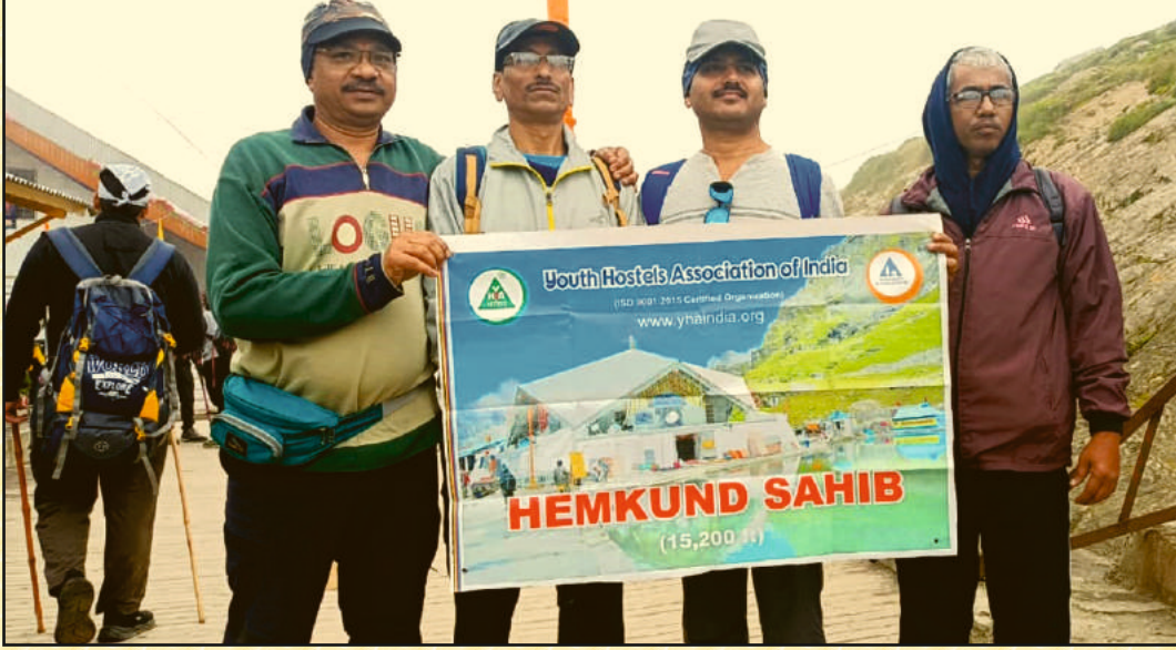
गिर्यारोहक दोधाणी-मार्गे-माथेरान मोहिमेतील सहभागी सचिवालय जिमखाना सभासद