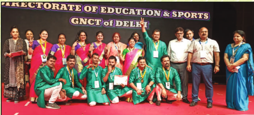
समूह गायन कांस्य पदक विजेता संघ